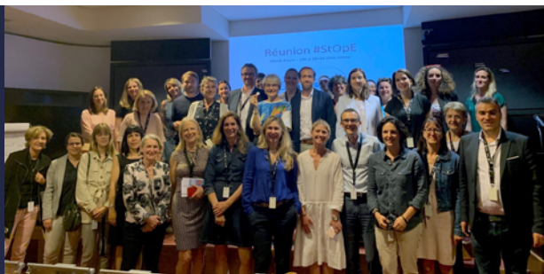
Réunion trimestrielle, juin 2019