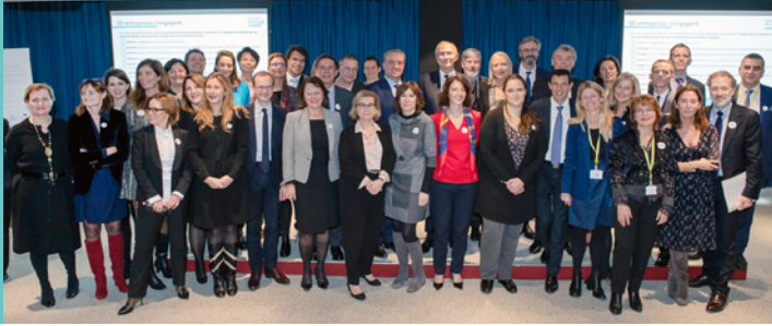
Les 30 premières entreprises à s'engager, cérémonie annuelle 2018