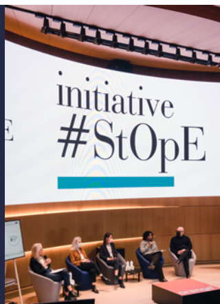
Table ronde Sexisme et génération , cérémonie annuelle 2022